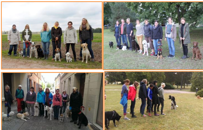
Teilnehmer der Weiterbildungen von 2013-2016.